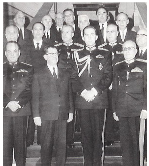
Ο βασιλιάς Κωνσταντίνος Β' ανάμεσα σε μέλη της δικτατορικής κυβέρνησης αμέσως μετά την ορκωμοσία του δεύτερου κλιμακίου στις 22 Απριλίου 1967. Διακρίνονται οι Παπαδόπουλος, Κόλλιας, Σπαντιδάκης (πρώτη σειρά), Ζωιτάκης, Παττακός (δεύτερη σειρά).

Σύμφωνα με τον Αμερικανό πρεσβευτή Φίλιπ Τάλμποτ, ο οποίος επισκέφθηκε τον Βασιλιά Κωνσταντίνο στα Ανάκτορα της οδού Ηρώδου Αττικού λίγο μετά την ορκωμοσία, ο Βασιλιάς Κωνσταντίνος του αποκάλυψε ότι δεν έλεγχε πλέον το στράτευμα και πως «Ορισμένοι απίστευτα βλάκες ακροδεξιοί μπάσταρδοι, που είχαν τον έλεγχο των τανκς, οδήγησαν την Ελλάδα στην καταστροφή». Ο Βασιλιάς ισχυρίστηκε ότι σκέφθηκε προς στιγμή να εκτελέσει τους πραξικοπηματίες, όταν έφτασαν στα Ανάκτορα για να ορκιστούν. Σκέφθηκε, όμως, ότι η κίνησή του δεν θα είχε καμία αξία, μια και τα Ανάκτορα ήταν περικυκλωμένα από τανκς επανδρωμένα από αξιωματικούς που τους ήταν πιστοί. Ο Βασιλιάς Κωνσταντίνος δεν ήταν καθόλου βέβαιος για τις επόμενες κινήσεις του και σκεπτόταν σοβαρά αν θα ήταν καλύτερο να μείνει ή να φύγει από τη χώρα. Ρώτησε τον Τάλμποτ πόσος χρόνος θα χρειαζόταν για να φτάσουν στο Τατόι αμερικανικά ελικόπτερα, προκειμένου να μεταφέρουν τον ίδιο και την οικογένειά του εκτός Ελλάδας και αν υπήρχε περίπτωση να αποβιβαστούν Αμερικανοί πεζοναύτες στην Ελλάδα για να τον βοηθήσουν να ανακτήσει τον έλεγχο των Ενόπλων Δυνάμεων [8] .