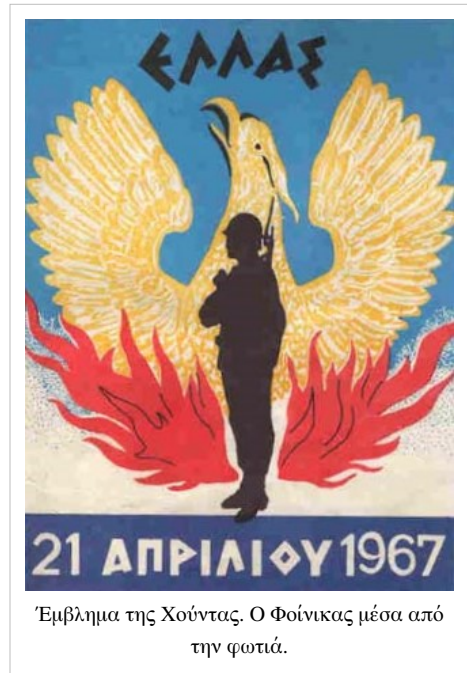
Έμβλημα της Χούντας. Ο Φοίνικας μέσα από την φωτιά.

Η δράση των αντιδημοκρατικών ακροδεξιών ομάδων αυτών εντάθηκε μετά τη νίκη στις εκλογές του 1963 της Ενώσεως Κέντρου με αρχηγό τον Γεώργιο Παπανδρέου, ο οποίος ήταν μεν αντικομμουνιστής, πίστευε όμως ότι η πολιτική διώξεων κατά των κομμουνιστών μάλλον τους ενίσχυε παρά τους αποδυνάμωνε. Οι πραξικοπηματίες φοβούνταν την πιθανότητα νέας νίκης της Ενώσεως Κέντρου στις προσεχείς εκλογές. Μια νίκη της θα σήμαινε ενίσχυση της πτέρυγας του Ανδρέα Παπανδρέου και πιθανή κάθαρση του στρατεύματος από τα υπερδεξιά στοιχεία. Μια τέτοια κάθαρση αναμφισβήτητα θα περιλάμβανε πολλά από τα ηγετικά στελέχη του κινήματος. Η προηγούμενη προσπάθεια ελέγχου του στρατεύματος από την κυβέρνηση είχε καταλήξει σε σύγκρουση με τα ανάκτορα και την Αποστασία του 1965. Αν η Ένωση Κέντρου επανεκλεγόταν, η παρέμβαση των ανακτόρων θα ήταν πολύ πιο δύσκολη. Την ίδια στιγμή οι αντιαμερικανικές δηλώσεις του Ανδρέα Παπανδρέου, η χείρα φιλίας που έτεινε προς την ΕΔΑ και οι προτροπές του για ενίσχυση της φιλίας με τις χώρες του Συμφώνου της Βαρσοβίας είχαν θορυβήσει όλους τους δεξιούς θεσμικούς και εξωθεσμικούς παράγοντες, περιλαμβανομένων και των Αμερικανών. Λόγω της προχωρημένης ηλικίας του Γ. Παπανδρέου ο Α. Παπανδρέου διαφαινόταν ως ο διάδοχός του σε περίπτωση νίκης στις επερχόμενες εκλογές.