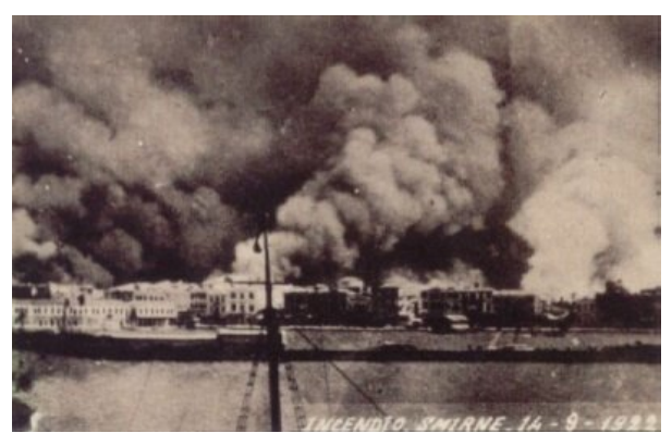
Η Καταστροφή της Σμύρνης, φωτογραφία από ιταλικό πλοίο, 14/9/1922

Με τον όρο καταστροφή της Σμύρνης αναφέρονται τα γεγονότα της σφαγής του ελληνικού και αρμενικού πληθυσμού της Σμύρνης από τους Τούρκους, καθώς και της πυρπόλησης της πόλης, που συνέβησαν τον Σεπτέμβριο του 1922. Η καταστροφή αυτή άρχισε 7 ημέρες μετά την αποχώρηση και του τελευταίου ελληνικού στρατιωτικού τμήματος από τη Μικρά Ασία και μετά την είσοδο του τουρκικού στρατού, του ίδιου του Μουσταφά Κεμάλ και των ατάκτων του στην πόλη. Η φωτιά εκδηλώθηκε αρχικά στην αρμενική συνοικία και συγκεκριμένα μετά την ανατίναξη της εκκλησίας του Αγίου Νικολάου από τους Τούρκους, όπου είχαν καταφύγει γυναίκοπαιδα. Με τη βοήθεια του ευνοϊκού για τους Τούρκους ανέμου (που έπνεε αντίθετα από την τουρκική συνοικία) και της βενζίνης με την οποία οι Τούρκοι ράντιζαν τα σπίτια, η φωτιά κατέκαψε όλη την πόλη, εκτός από τη μουσουλμανική και την εβραϊκή συνοικία [1] , και διήρκεσε από τις 13 έως τις 17 Σεπτεμβρίου του 1922.