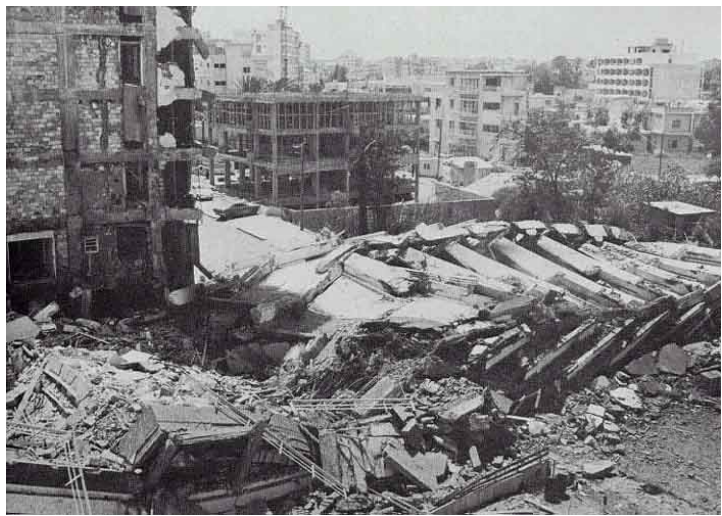
Βομβαρδισμός Αμμοχώστου 1974

Μία απόπειρα της Τουρκίας να εισβάλει στο νησί και να επιβάλει την διχοτόμηση ήταν στις 25 Φεβρουαρίου 1964, όταν η Κυπριακή Δημοκρατία εξήγγειλε τον αφοπλισμό των ατάκτων και τη δημιουργία μιας δύναμης 5.000 ειδικών αστυνομικών. Αυτό έμελλε να είναι το πρώτο βήμα για τη δημιουργία στρατού της Κύπρου, που αργότερα πήρε την ονομασία «Εθνική Φρουρά». Την 1η Ιουνίου 1964 θεσπίστηκε νόμος που προέβλεπε υποχρεωτική στρατιωτική θητεία. Ο νόμος προκάλεσε τις διαμαρτυρίες της Τουρκίας και της Αγγλίας. Ο Κουτσιούκ, ο οποίος μετά τις