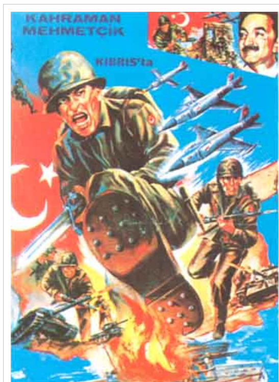
Κρατική τουρκική αφίσα της Εισβολής 1974

Η Κυπριακή Δημοκρατία κάλεσε την Τουρκία, να προσφύγουν και οι δυο χώρες στο Διεθνές Δικαστήριο της Χάγης για να γνωματεύσει κατά πόσο νόμιμα εισέβαλε η Τουρκία στην Κύπρο. Η Τουρκία όμως αρνείται. [6]