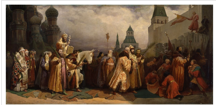
Κυριακή των Βαΐων στη Μόσχα με συμμετοχή του Τσάρου Αλέξανδρου Β'. (πίνακας του V. Greg. Schwarz, 1865).

Στην Ελλάδα αντ' αυτών διατηρείται μόνο η διανομή των βαγιών από τους ιερουργούς των εκκλησιών.